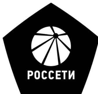
Рисунок Р.1 – Изображение фирменного знака качества ПАО «Россети»